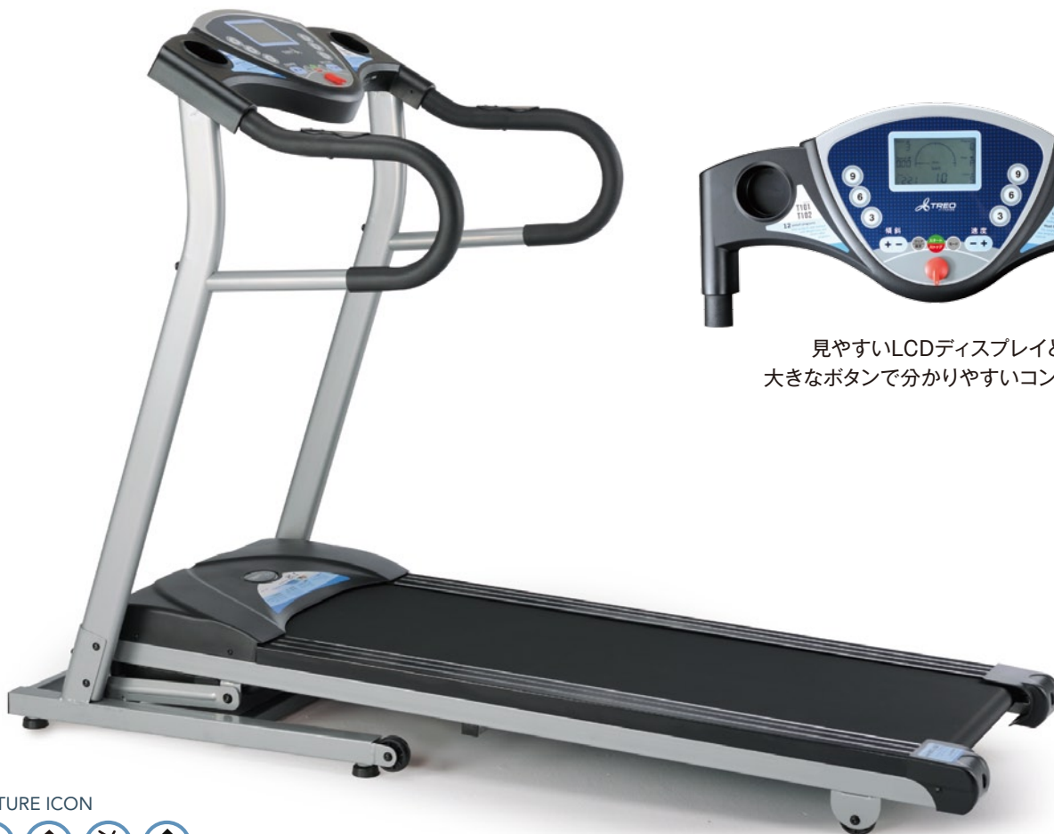
見やすいLCDディスプレイと、 大きなボタンで分かりやすいコンソール。

広い走行面に加え、ワンタッチのスピード調節や 電動傾斜機能も搭載された、ランナーに嬉しいマシン。 傾斜をつけての坂道トレーニングや多彩なプログラムで、 体カアップ・シェイプアップにも適しています。